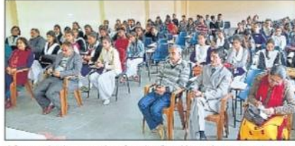
डोईवाला कॉलेज में शुक्रवार को कार्यक्रम में शामिल प्रोफेसर और छात्र-छात्राएं।